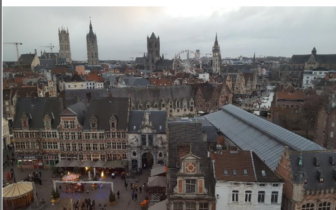
Ausblick von der Burg Gravensteen in Gent, Belgien

Von meinen Ausflügen in Belgien hatte jede Stadt für sich seine Besonderheiten. In Lüttich habe ich die besten Waffeln gegessen und war auf dem schönsten Weihnachtsmarkt, Antwerpen hat mir architektonisch unglaublich gut gefallen und Brüssel bietet zahlreiche verschiedene kulturelle Angebote. Am besten gefallen hat es mir jedoch in Gent, da durch die Stadt zahlreiche Kanäle fließen und eine fast schon verwunschene Stimmung herrscht.