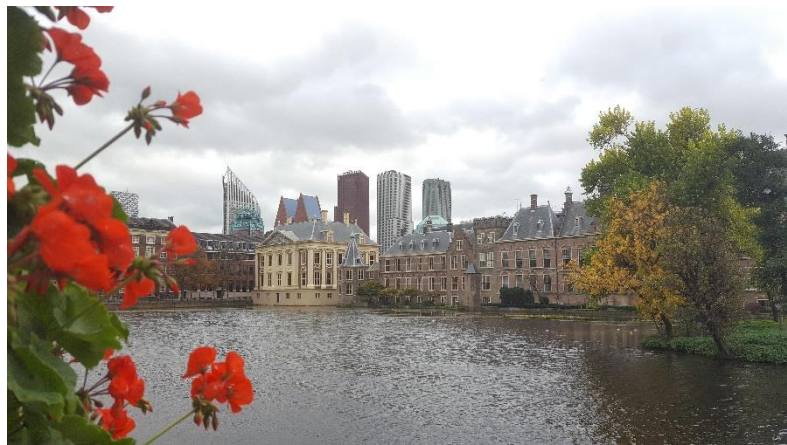
Den Haag, Niederlande

Da Belgien sowohl an Frankreich als auch an die Niederlande grenzt, habe ich während meines Praktikums die Möglichkeit gehabt, ein langes Wochenende in Paris zu verbringen und einen Tagesausflug nach Den Haag, den Regierungssitz der Niederlande, und an die holländische Nordsee zu machen.