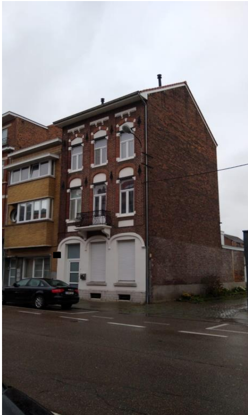
Meine Unterkunft in Tienen, Belgien

Die Unterkunft ist ein Reihenhaus in der Gemeinde Tienen in Belgien. Tienen hat ca. 30.000 Einwohner und bietet in fußläufiger Entfernung alles, was man zum Leben braucht. In dem Reihenhaus gibt es 8 Zimmer auf 3 Etagen verteilt, welche ausschließlich an Bosch-Praktikanten vermietet werden. So ist ein gutes Sozialleben während des Praktikums gegeben. Das Haus beinhaltet außerdem 3 Badezimmer, 2 Toiletten, eine große Küche und ein Wohnzimmer, einen