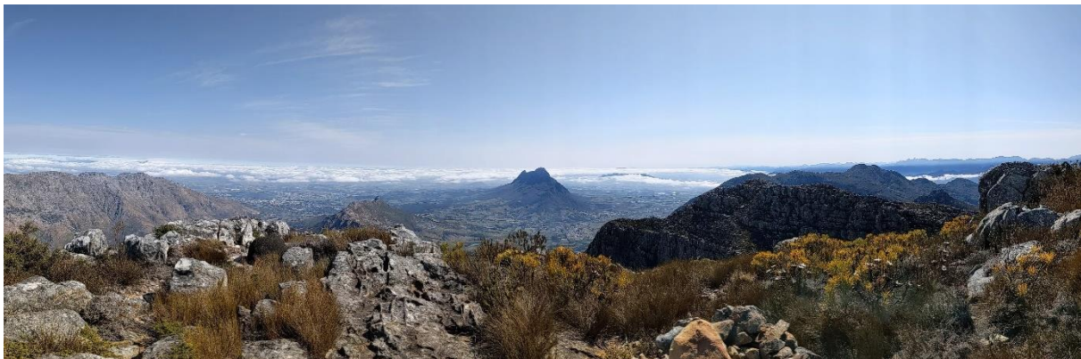
Abbildung 1 Aussicht vom Pieke

Ich bin damit einverstanden, dass mein Erfahrungsbericht anonymisiert auf den Internetseiten des International Office der HSD veröffentlicht wird bzw. an interessierte Studierende weitergegeben.