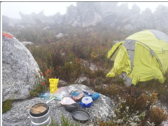
Abbildung 19 Camping auf dem Stellenboschberg