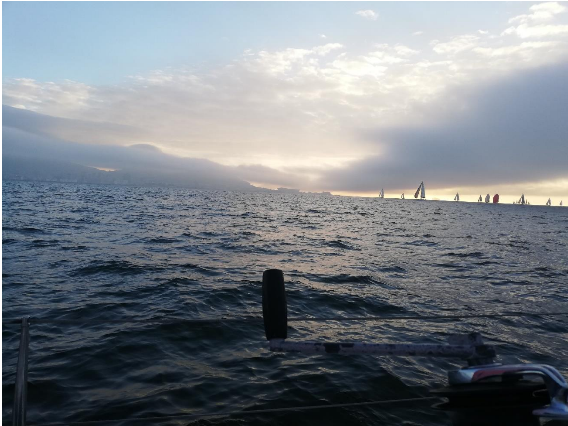
Abbildung 12 wöchentliches Segeln am Fuße des Tafelberges

Anbei noch ein paar andere Fotos aus dem Jahr: