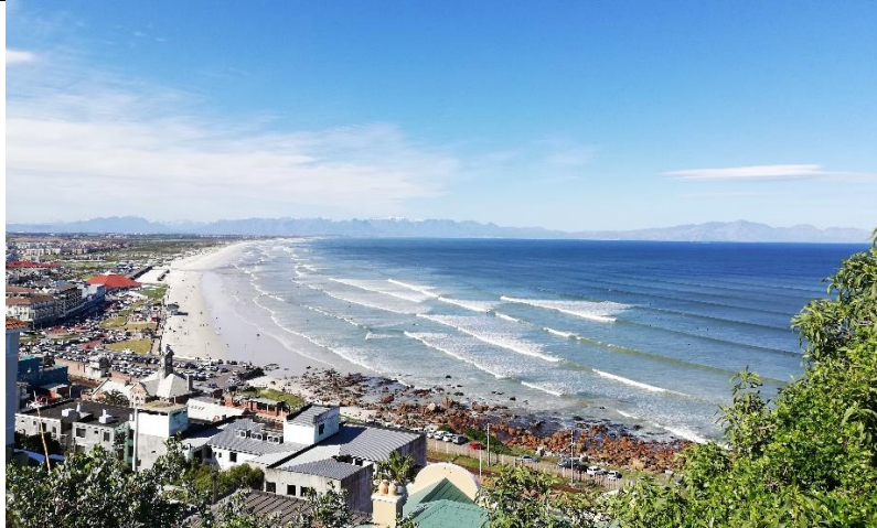
Abbildung 10 Muizenberg

Bezüglich Tagesausflüge gibt es hier in der Umgebung unzählige Möglichkeiten.