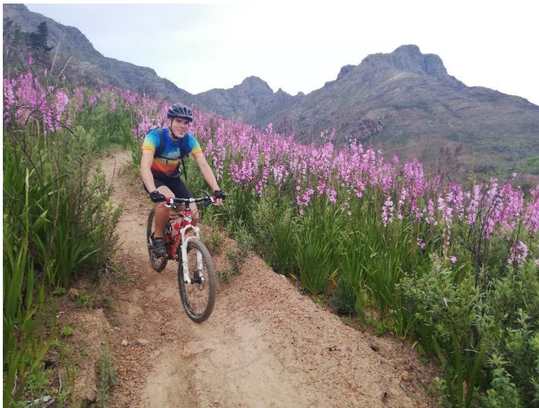
Abbildung 9 Mountainbike Tour

Das Fahrradfahren ist in Südafrika leider nicht so verbreitet, wie in Deutschland. Stellenbosch ist hier aber noch die fahrradfreundlichste Stadt in ganz Südafrika. Da die Kriminalität sehr hoch ist, werden die Fahrräder sehr schnell gestohlen. So kann man ein Fahrrad leider nirgendwo abstellen, auch wenn es sehr gut abgeschlossen ist. Dennoch habe ich mir in der zweiten Woche ein gebrauchtes Mountainbike gekauft, um damit in einer der weltbesten Trails zu fahren. Die Mountainbikestrecken um Stellenbosch herum sind großartig und sehr viele Menschen aus aller Welt kommen zum Mountainbiken hierher.