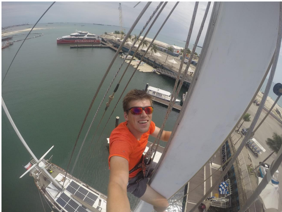
Abbildung 18 Arbeiten auf einem Segelboot in Tasania