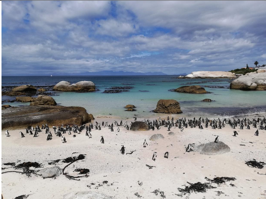
Abbildung 15 Boulders Beach