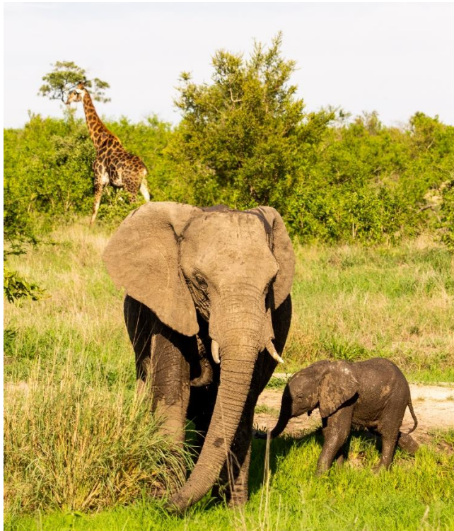
Abbildung 11 Kruger National Park

Im Dezember nach den Letzen Klausuren ging es für mich nach Somerset West, wo wir beim Wandern in Höhlen übernachtet haben. Danach ging es als Roadtrip mit dem Toyota Hilux und Dachzelten von Johannesburg aus in den Kruger Nationalpark.