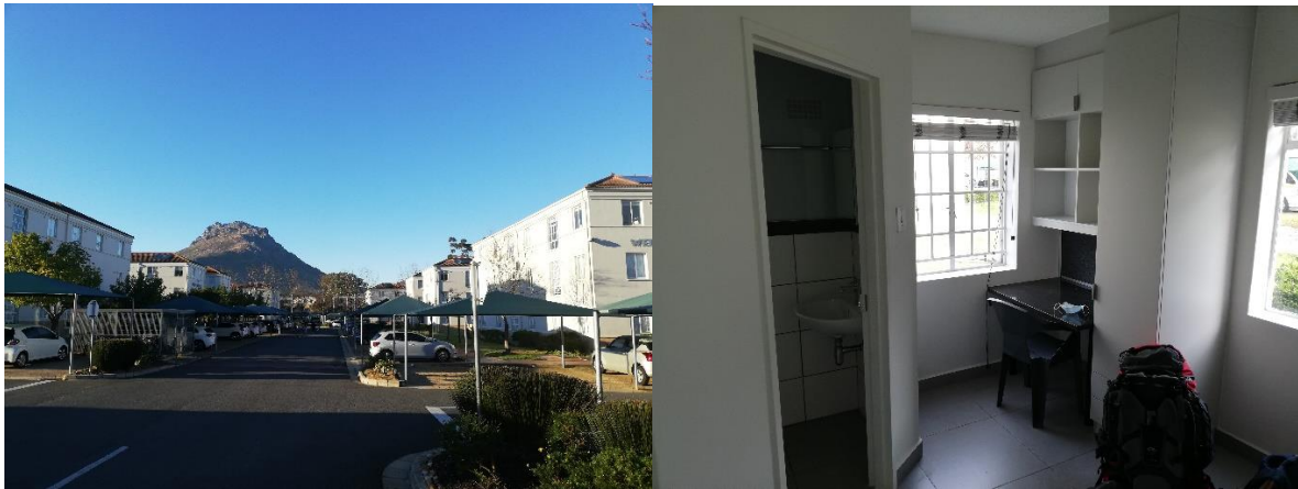
Abbildung 2 Studentenwohnheim Academia

Die Unterkunft ist mit 600 € im Monat zwar etwas teuer, aber eine gute und sichere Möglichkeit für Stellenbosch. Academia ist ein riesiges Studentenwohnheim-Gelände mit ca. 1000 Studierenden. Die Häuser bestehen aus drei Etagen mit jeweils 8 Einzelzimmer. Jedes Zimmer hat ein eigenes Badezimmer und der Gemeinschaftsraum ist mit vier Küchenzeilen integriert.