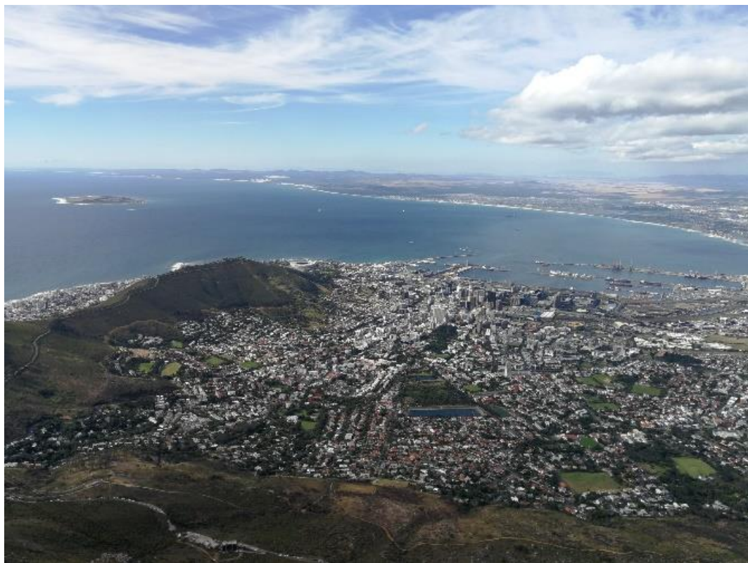
Abbildung 14 Cape Town vom Tafelberg aus