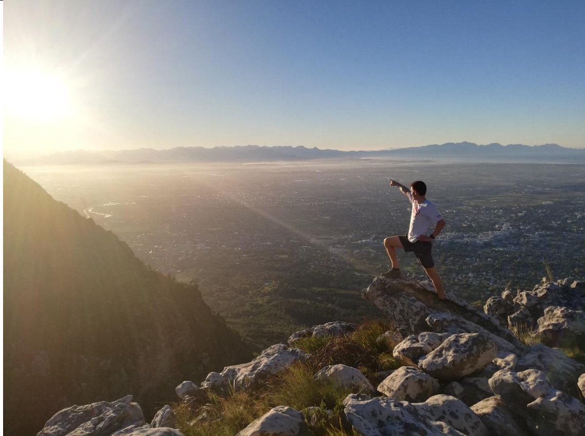
Abbildung 17 Trail running auf dem Tafelberg