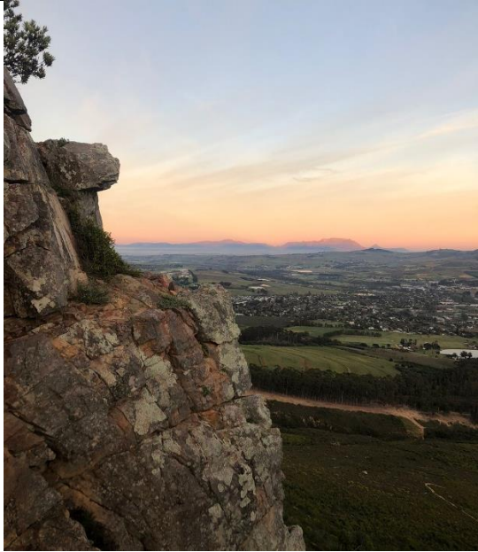
Abbildung 8 Sonnenaufgang Stellenbosch

Das Fahrradfahren ist in Südafrika leider nicht so verbreitet, wie in Deutschland. Stellenbosch ist hier aber noch die fahrradfreundlichste Stadt in ganz Südafrika. Da die Kriminalität sehr hoch ist, werden die Fahrräder sehr schnell gestohlen. So kann man ein Fahrrad leider nirgendwo abstellen, auch wenn es sehr gut abgeschlossen ist. Dennoch habe ich mir in der zweiten Woche ein gebrauchtes Mountainbike gekauft, um damit in einer der weltbesten Trails zu fahren. Die Mountainbikestrecken um Stellenbosch herum sind großartig und sehr viele Menschen aus aller Welt kommen zum Mountainbiken hierher.