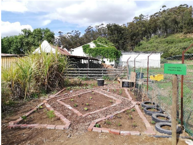
Abbildung 4 selbst entworfener Gemüsegarten

Dieses Fach ist ein GEP Modul. Das heißt, dieses Modul richtet sich besonders an internationale Studierende. Das Modul bestand aus 90 Minuten Präsenzvorlesung pro Woche, in der Grundwissen über die Landwirtschaft vermittelt wurde. Auch der Aufbau und die Funktionsweise einer Pflanze wurden für mein geringes Vorwissen doch sehr detailliert behandelt. Das Beste war aber das praktische „Gardening“. Kurz gesagt, dort haben wir innerhalb von zwei Stunden pro Woche praktisch gelernt, wie man am besten einen Gemüsegarten anbaut. Eine Prüfung war dann auch praktisch, wo wir als Team innerhalb von zwei Wochen ein neues Gebiet bepflanzen sollten.