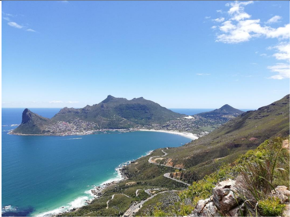
Abbildung 13 Hout Bay Wanderung