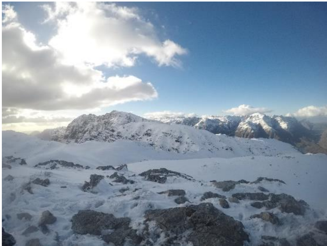
Abbildung 16 Schnee auf dem Perdekop