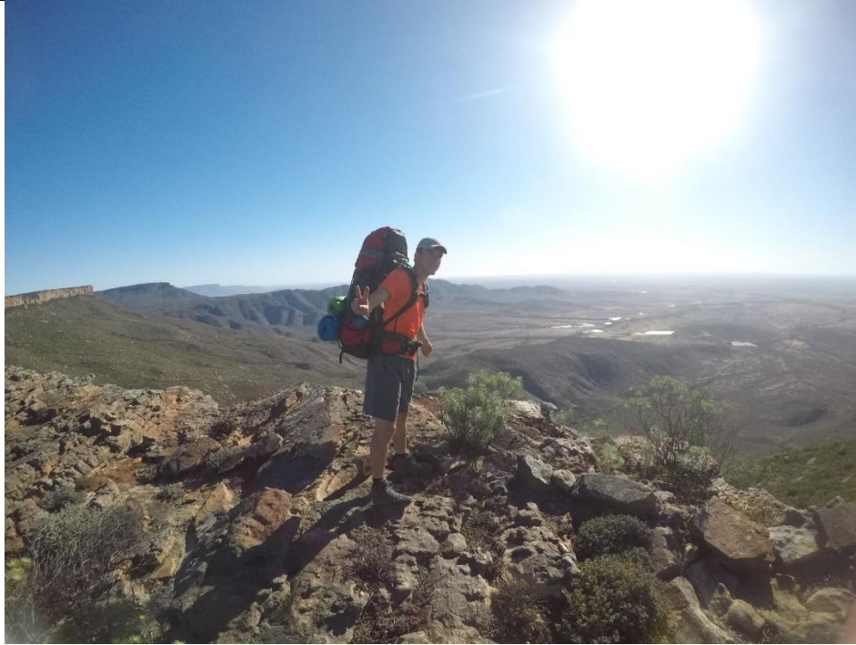
Abbildung 7 5 Tages Wanderung in Oorlogskloof

An dieser Stelle möchte ich auch mal die „afrikaans“ Kultur erwähnen, welche in Stellenbosch und insbesondere im BTK sehr ausgeprägt ist. Die „afrikaans“ Kultur ist keine einheimische, sondern westlich und stammt von den Niederländern ab. So wird die Sprache „Afrikaans“ im Raum Stellenbosch auch mehr als Englisch gesprochen. Aber jeder der Afrikaans spricht, kann auch Englisch sprechen.